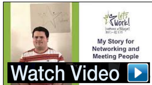
关于社交、讲故事的技巧的视频