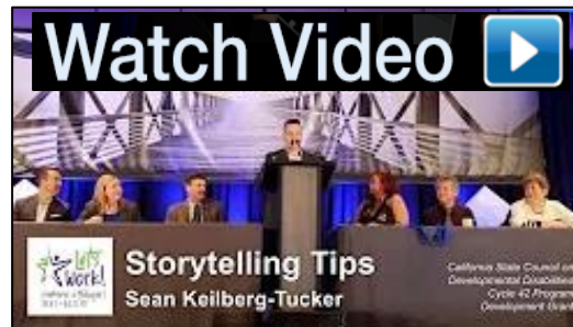
自信地分享你的故事的小技巧