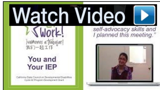
你和你的个性化教育计划