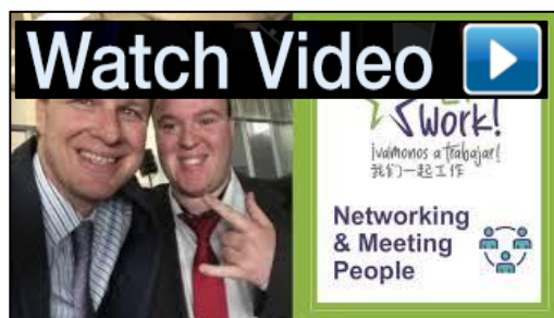
关于建立人际网络和与人会见的视频